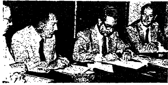
المحافظ التمار ورئيس البعثة الإيطالية يوقعان الاتفاق